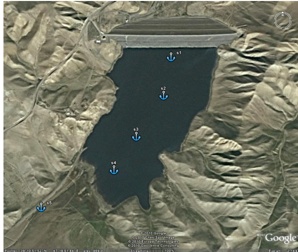
شکل ۱- عکس ماهواره‌ای دریاچه ارسباران و محل ایستگاه‌های نمونه‌برداری

آزمون‌های غیرپارامتریک کروسکال-والیس و من-ویتنی در برنامه‌های آماری SPSS نگارش ۱۳ و ترسیم نمودارها از نرم‌افزارهای Excel 2003 با نگارش ۱۳ استفاده گردید.